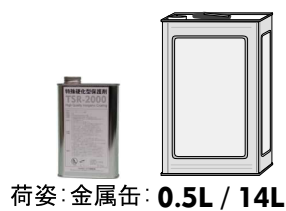
荷姿: 金属缶: 0.5L / 14L