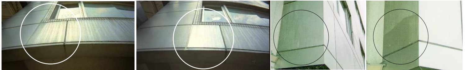
陽極酸化被膜仕様アルミパネル(シルバー)