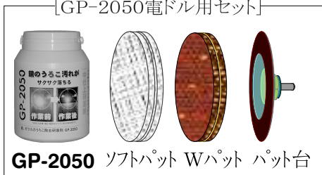
GP-2050 ソフトパット Wパット パット台