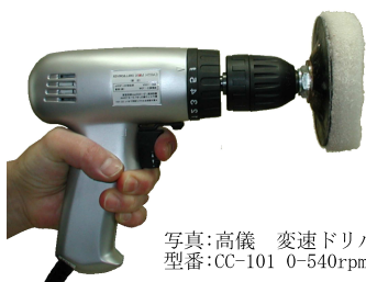
写真:高儀 変速ドリル 型番:CC-101 0-540rpm